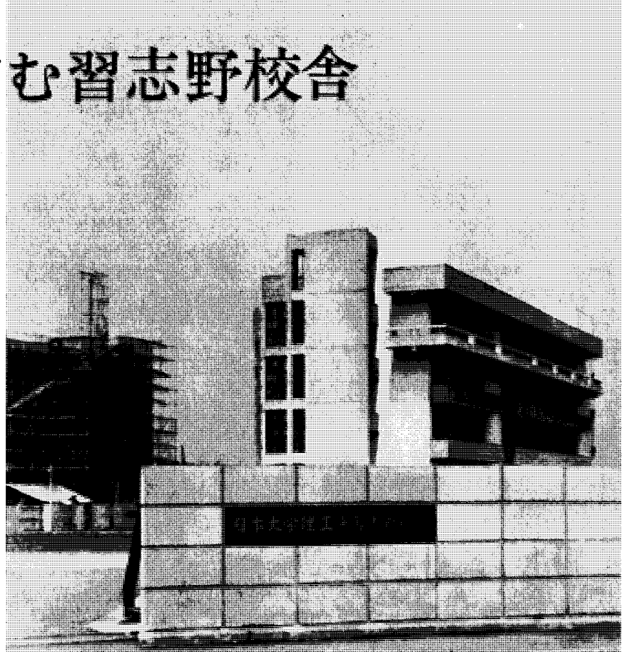
仮正門からみた2号館と建設中の3号館

日本大学が船橋市習志野町の広々とした12万坪の土地に建設中の理・工系習志野校舎は、すでに教養1号館同2号館が竣工、いま同3号館の工事が急がれているが、さらに明春完工をめざして、精密機械工学・交通工学専用校舎と、いま2号館の地下におかれている食堂を別棟で建て、運動施設（野球場、グラウンド、道場）部室も新設する。