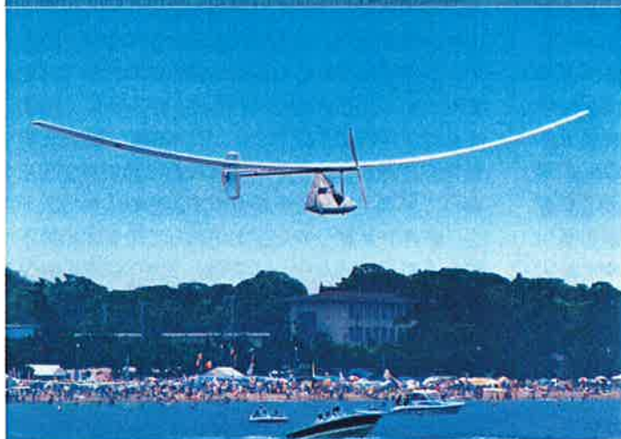
(日大バードマン・チームの人力飛行機)