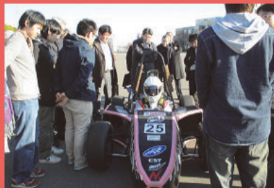
フォーミュラ工房