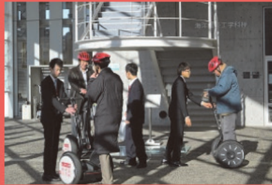
交通まちづくり工房