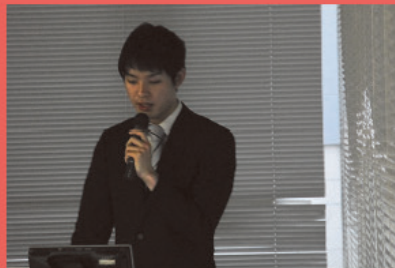
物理プロジェクト工房（発表）