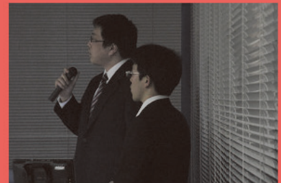
電気エネルギー環境工房（発表）